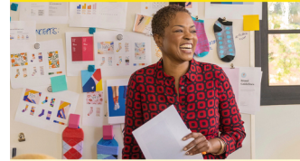
Original HP Tinte

Brillante Farben und gestochen scharfe Texte zeigen Ihr Unternehmen von seiner besten Seite