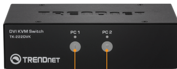
Boutons de sélecteur de PC