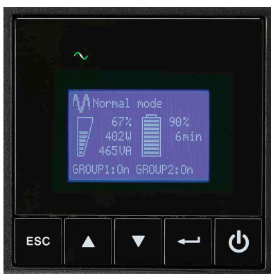
Grafisches LCD-Display der 9SX