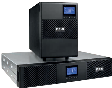
Rack- und Tower-Modell der 9SX