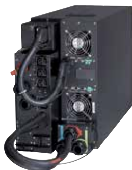
9PX 11kVA avec bypass de maintenance