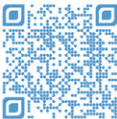
Video zur Eaton 9PX