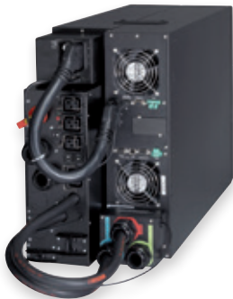
Eaton 9PX 11kVA mit Wartungsbypass

Die 9SX ist eine Energy Star® qualifizierte USV